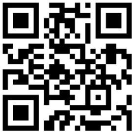
大会 HP:QR コード

なお、今大会は本年1月に大阪府で開催された第16回学術大会から日程的にも地理的にも間隔が狭いことから、2025年11月1日から11月30日の1か月間、現地会場を設けずオンデマンド配信を用いたオンライン形式での開催として、ご自宅から気軽に参加できる大会としましたので、皆様のご参加を心からお待ちしております。